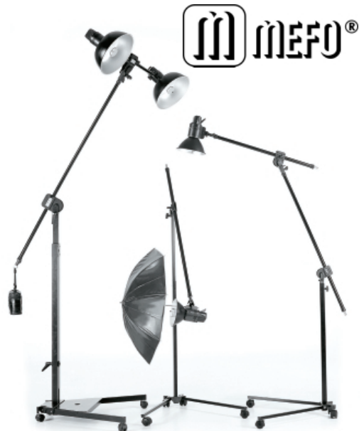
ST-041 longitud cerrado 154cm. Combi-Stand II